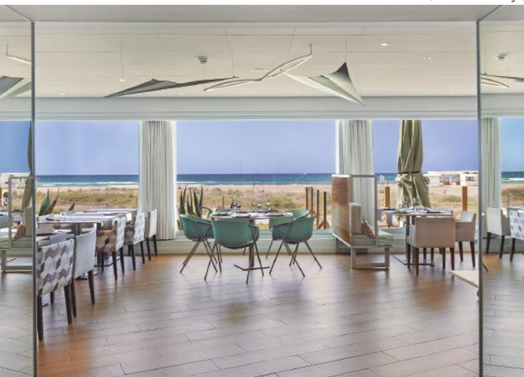
Hotel Belair

Inmersas en cómo se tenía que diseñar una nueva oficina, llegó el proyecto que nos catapultó definitivamente a seguir