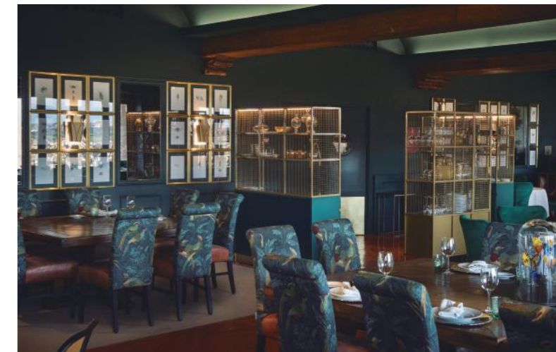
Parador de Toledo

Los principales valores del estudio son la creatividad en el diseño y el rigor en el cumplimiento de los objetivos del cliente, aportando un valor añadido que haga cada proyecto diferente y plenamente competitivo.