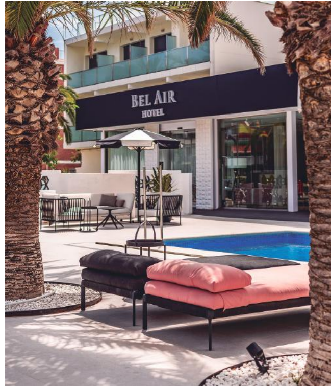
Hotel Belair

El primero siempre será recordado, el Hotel Axel, por lo que significó... por diseñar algo que nunca antes has diseñado, fue un ejercicio apasionante ponerse en la piel del cliente que quiere hacer algo distinto y que nunca antes había tenido un hotel pensado para él, este proyecto siempre estará en la memoria.