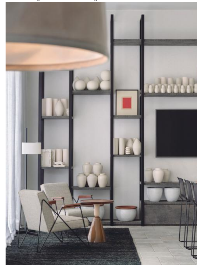
Parador de Aiguablava

¿Cuáles son los items que conforman sus valores y filosofía?