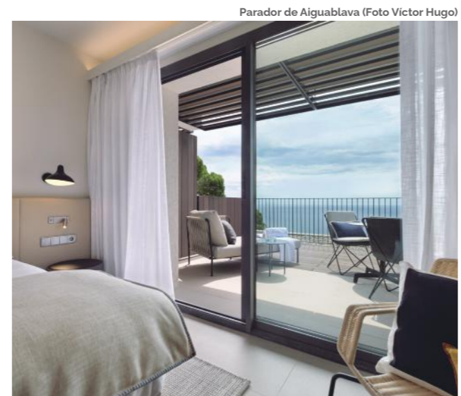
Parador de Aiguablava

Eso se traduce en espacios comunes y habitaciones donde tendremos que ser imaginativos y utilizar toda nuestra creatividad para que sean espacios que respeten las normas pero que también sean atractivos, creo que los nuevos materiales, la tecnología y la domótica nos van a ayudar mucho en ese sentido.